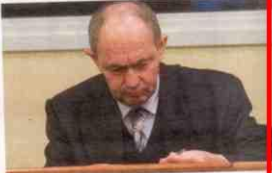
MAKSIMALNA KAZNA Zdravko Tolimir je osuđen za genocid u Srebrenici

H aški tribunal osudio je juče generala Vojske Republike Srpske Zdravku Tolimira na doživotni zatvor, proglašivši ga krivim za genocid nad muslimanima iz Srebrenice u leto 1995. General Tolimir (64) je tokom rata u BiH bio pomoćnik za obaveštajno-bezbednosne poslove tadašnjeg komandanta VRS Ratka Mladića. Tribunal je, većinom glasova dvoje sudija, uz protivljenje jednog, Tolimira proglasio krivim za genocid, udruživanje radi počinjenja genocida, istrebljenje, ubistva, progon i premeštanje Muslimana iz Srebrenice i Zepce od jula do novembra