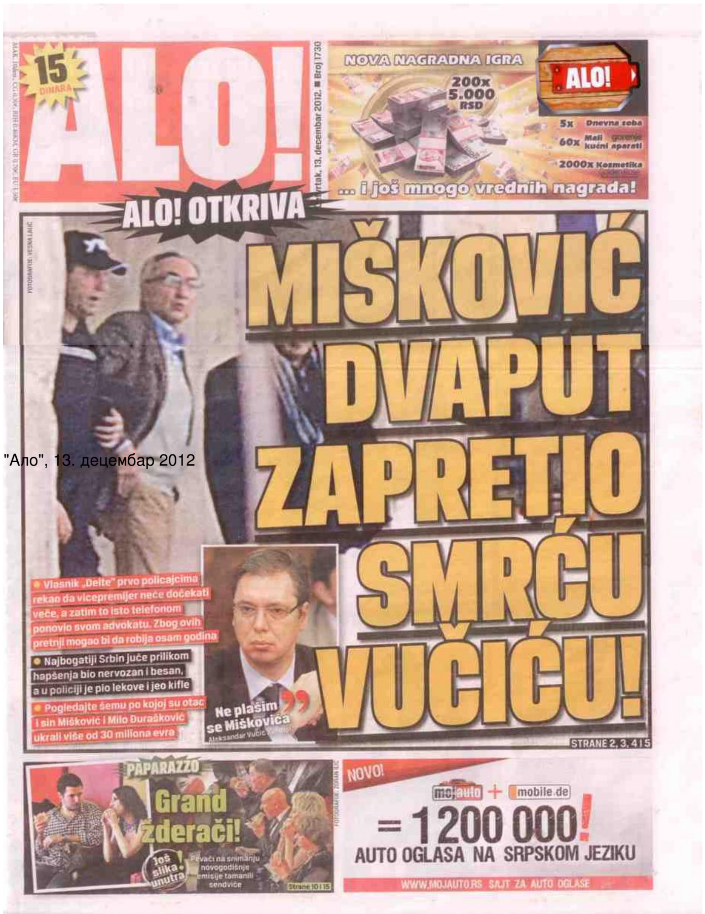
"Ало", 13. децембар 2012