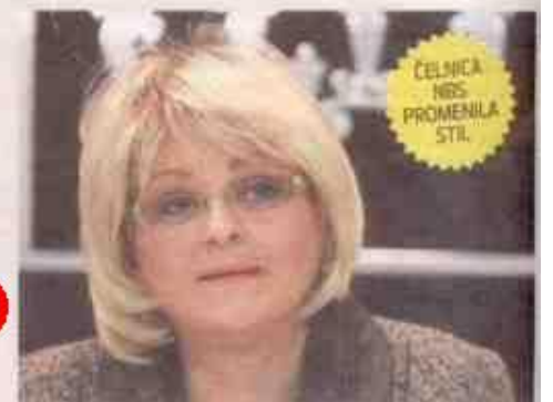
ČELNIKA NBS PROMENILA STIL

BEOGRAD - Ipak plavuša. Guvernerka Narodne banke Srbije Jorgovanka Tabaković promenila je imidž. Sudeći prema fotografijama nastalim na jučešnja konferenciji povodom odobraz-