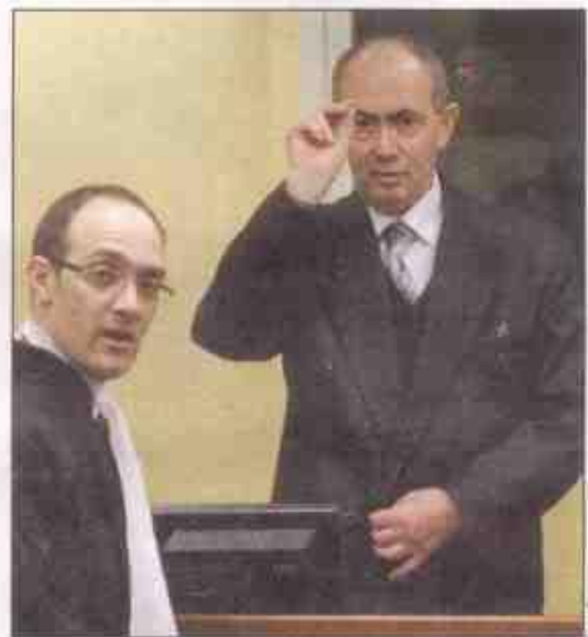
„Desna ruka, oči i uši“ Ratka Mladića, piše u presudi: Zdravko Tolimir

Према пресуди, масовна убиства srebreničких Muslimana