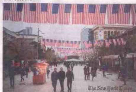
American flags streamer recently above the main street of Pristina, Kosovo capital. One of the world's poorest countries Kosovo depended from Serbia, with the support of the United States. Published December 11, 2012