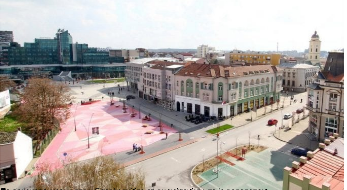
Београдски центар за младе, који је изграђен у Београду, је изведен на бетон.