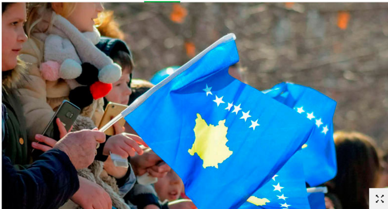
Alles auf einer Karte: Feier zum 11. Jahrestag der Unabhängigkeit in der Hauptstadt Pristina.