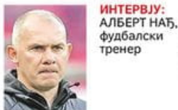
ИНТЕРВЈУ: АЛБЕРТ ХЕБЕРБРАНД, фудбалски тренер

КАКО СУ УГЛЕДНИ СРБИ ГРАДИЛИ ЗАГРЕБ Палате и задужбине сведоци некада моћне и славне српске заједнице стр. 6