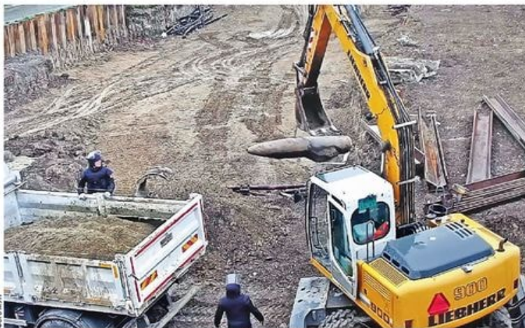
Вађење авио-бомбе НАТО-а на градилишту у нишком насељу Стеван Синђелић