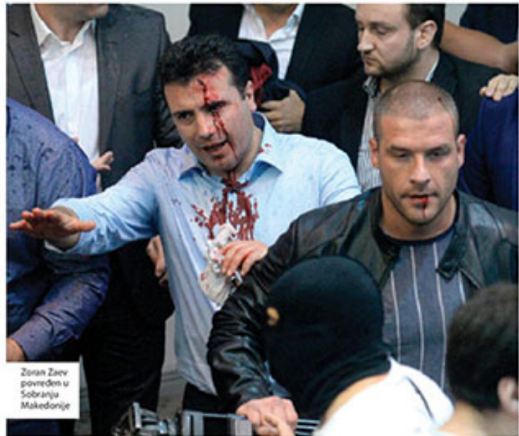
Zoran Zaev povređen u Saboranju Makedonije