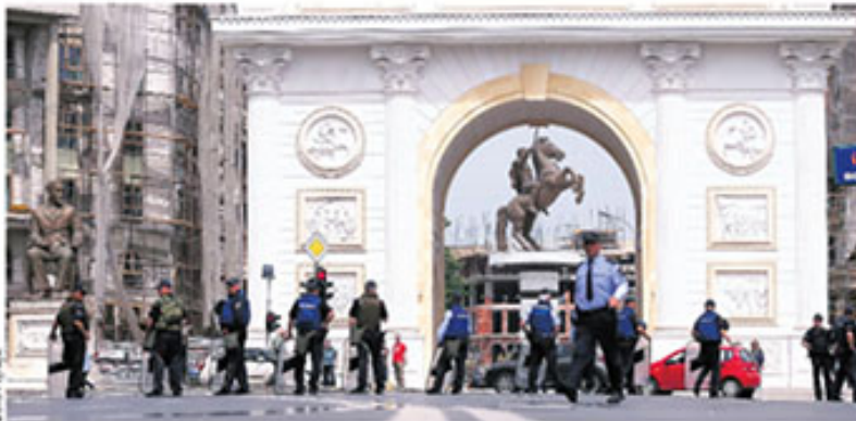
Напетост у Скопљу и јуче је била приметна

Зоран Заев најавио да ће после избора Талата Цаферџија за председника Собранија политички процес бити настављен избором нове македонске владе