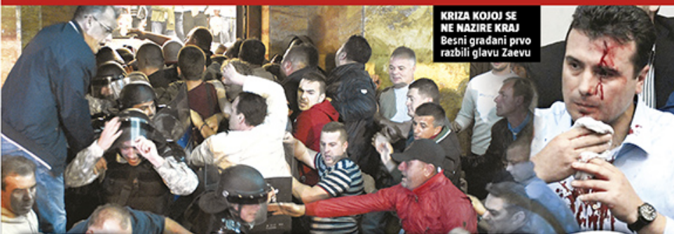
KRIZA KOJOJ SE NE NAZIRE KRAJ Besni građani prvo razbili glavu Zaevu