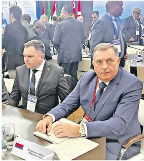
Председник РС на скупу о безбедносним питањима