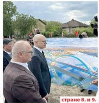
странице 8. и 9.