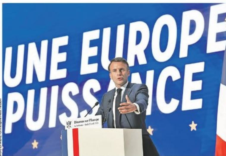
Медијски садржаји које гледају деца и адолесценти у ЕУ све више су „амерички и азијски“: француски председник

Русији се не сме дозволити да победи у Украјини, морамо да изградимо стратешки концепт кредибилне одбране