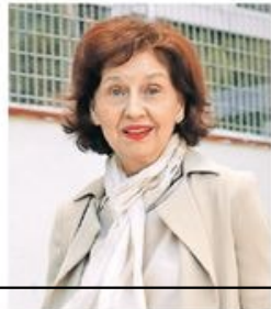
Гордана Сиљановска Давкова

Скопље – У првом кругу председничких избора у Северној Македонији кандидат ВМРО-ДПМНЕ Гордана Сиљановска Давкова освојила је 40,08 одсто, док је актуелни председник Стево Пендаровски освојио 19,93 одсто популарности, саопштилa је Државна изборна комисија. Њих двоје ће снаге одмерити у другом кругу председничких избора 8. маја, за када су заказани и парламентарни избори. страница 4