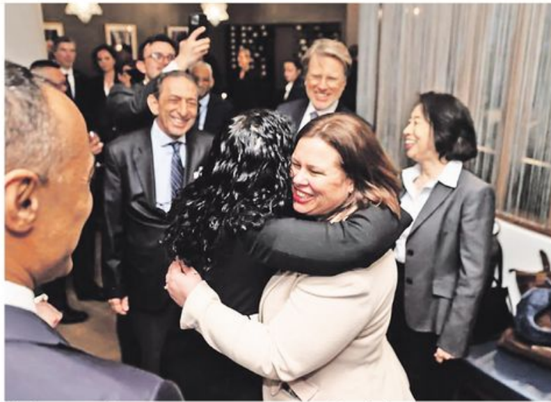
Вјоса Османи у загрљају са заменицом сталног представника Малте у Савету безбедности