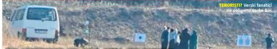
TERORISTI? Verski fanatici na poligonu voške BiH