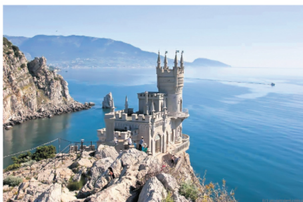
Замак Ластавица из 19. века на кримској обали Црног мора

Украјина ставила на „црну листу“ три члана СРС-а и писца Срђу Трифковића, као и чешког посланика Јарослава Голика, али не и британског парламентарца Најџела Сусмана