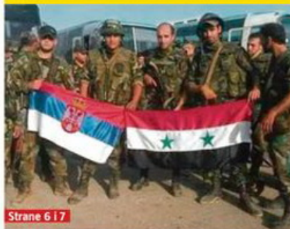
Strane 6 i 7