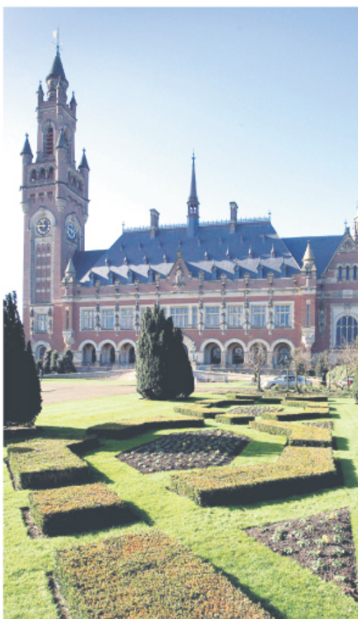
Међународни суд правде у Хагу