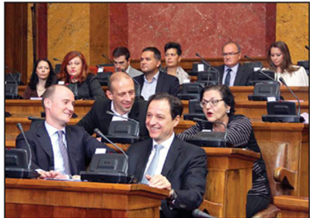
Porazno je što jedan čovek odlučuje o izborima: Demokrate u Skupštini

Podrška kompletne vladajuće koalicije jednom predsedničkom kandidatu jasno govori da stranke vlasti ne žele parlamentarne izbore. Teško je sa da zamisliti poziciju SPS na vanrednim