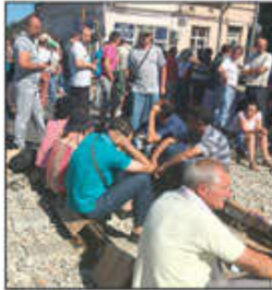
Radnici Goše danas protestuju u Beogradu

„Ako Ana Brnabić ne zna šta da radi, neka se povuče“