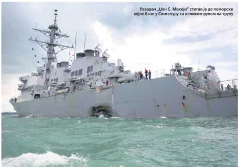
Разарач „Џон С. Мекејн” стигао је до поморске војне базе у Сингапур са великом рупом на трупу