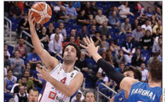
Izostanak Miloša Teodosića sa Evrobasketa šokirao naciju