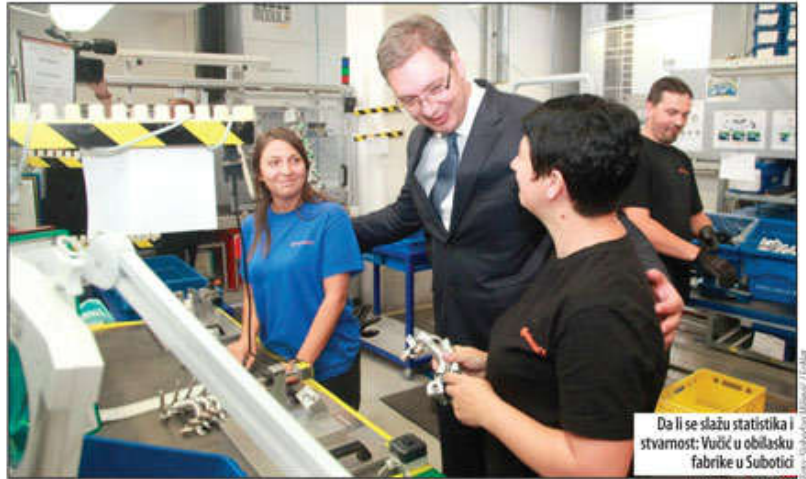
Da li se slažu statistika i stvarnost: Vučić u obilasku fabrike u Subotici

Zaključak poverenice za ravnopravnost Brankice Janković povodom sahranjivanja u Novom Pazaru