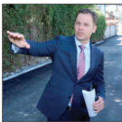
TRAGOM: Da li je falsifikovan potpis gradonačelnika Beograda u aferi „24 stana“