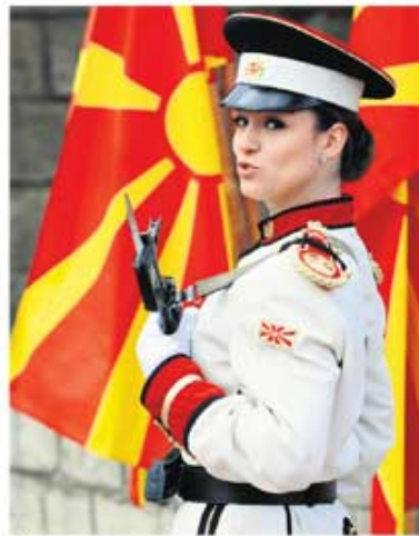
Македонска капларка на стражи у Скопљу