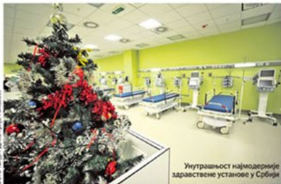
Унутрашњост најмодерније здравствене установе у Србији

ђеном и од темеља реконструисаном старом објекту, који је почео да се гради још пре скоро четири деценије, али никада није завршен. страница 5