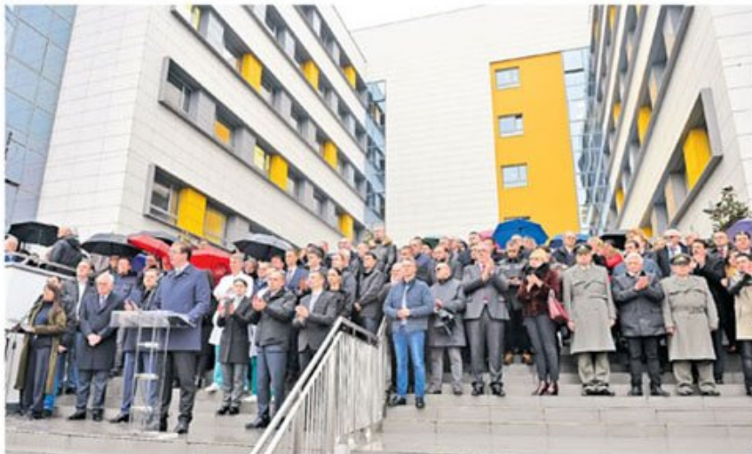
Државни врх Србије испред новог Клиничког центра у Нишу

Ниш – У присуству највишег државног врха Србије, представника Нишавског и свих околних југ и југоисточних крајева, јуче је свечано отворен и предат на коришћење нови Клинички центар Ниш, први од четири који у наредних неколико година треба да буду завршени. Свечаности у Нишу присуствовали су председник Србије Александар Вучић и председница Владе Ана