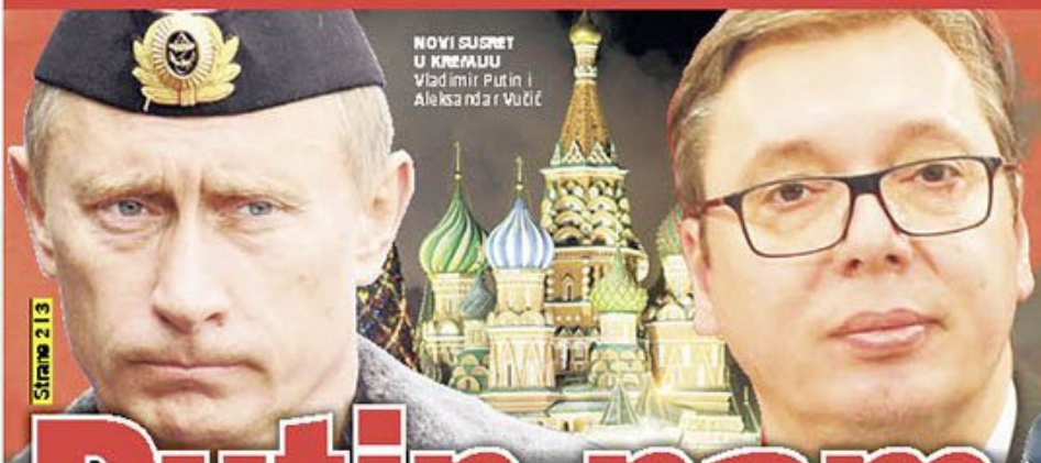
NOVI SUSRET U KREMLJU Vladimir Putin i Aleksandar Vučić