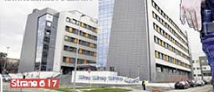
Strane 6 i 7

NOVI KLINIČKI CENTAR U NIŠU NAJMODERNIJI U ZEMLJI