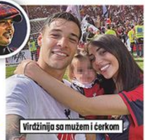
Virdžinija sa mužem i ćerkom