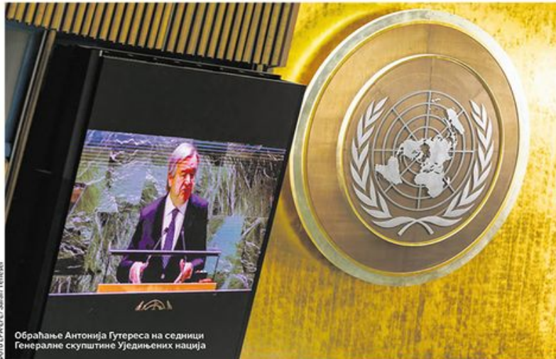
Обраћање Антонија Гутерреса на седници Генералне скупштине Уједињених нација

Иран спреман и за „максималан“ одговор стр. 3