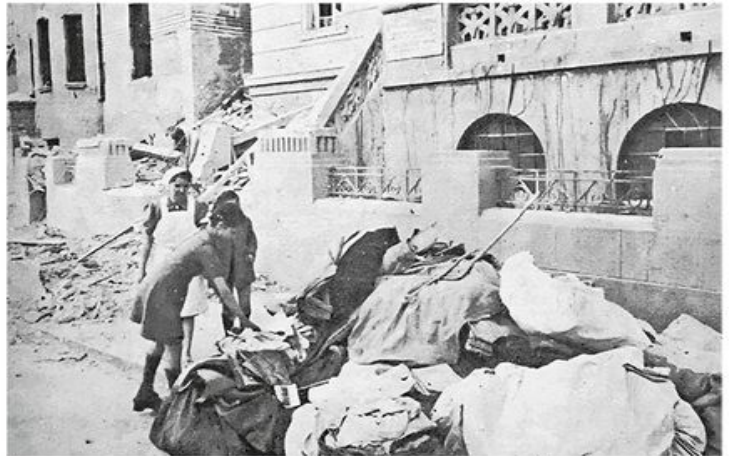
Разорено породилиште „Краљице Марије“, данашња Студентска поликлиника у Крунској улици