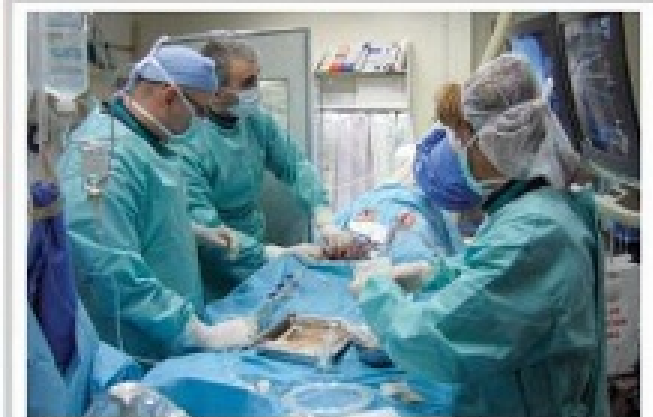
Rodina preminula g pacijenta optužuje hirurge Kardiovaskularne klinike u Nišu

„Porodi i u Srbiji na evropski Odbor za evropsku integraciju. Za članovima Dveri, Srbije - čim se do sada opremili“, napisao je Ivošević na ovom Twitter naloga. J. D. M. R. M. Strana 18