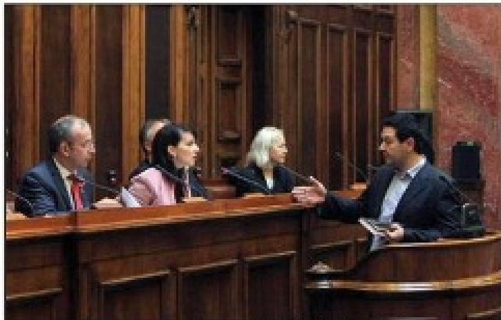
Kad bih znao izveštajne uprkos jerku: Službeni odbor za evropsku integraciju