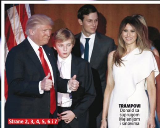
Strane 2, 3, 4, 5, 6 i 7