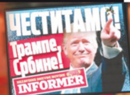
ALAL VERA Naš bilbord u centru Beograda

Број 1382 / 20 динара / RS 0,5 KM / CG 0,4 EUR