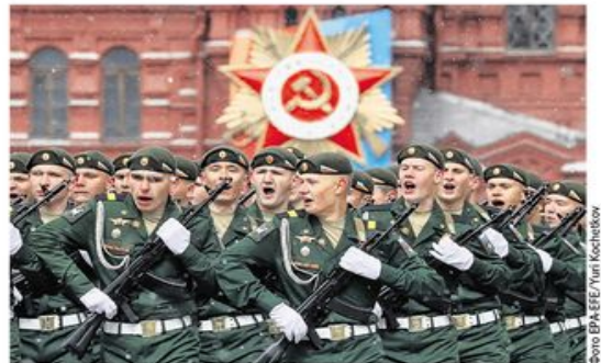
Учесници параде на Црвеном тргу у Москви

Посета Сија утемељила нови поредак на Балкану стр. 5