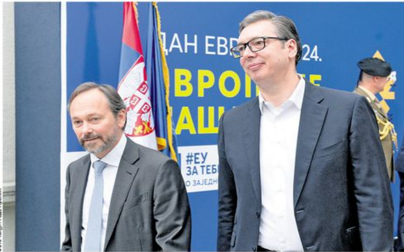
Емануел Жиофре и Александар Вучић