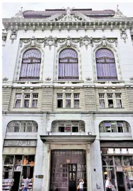
Седиште Српске академије наука и уметности