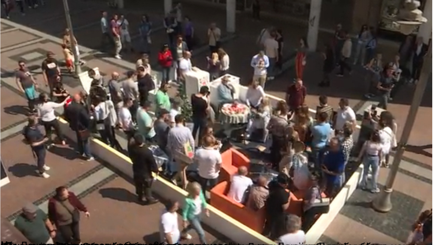
Нишка опозиција направила перформанс „како 90 бирача стане у 30 квадрата“ на централном г