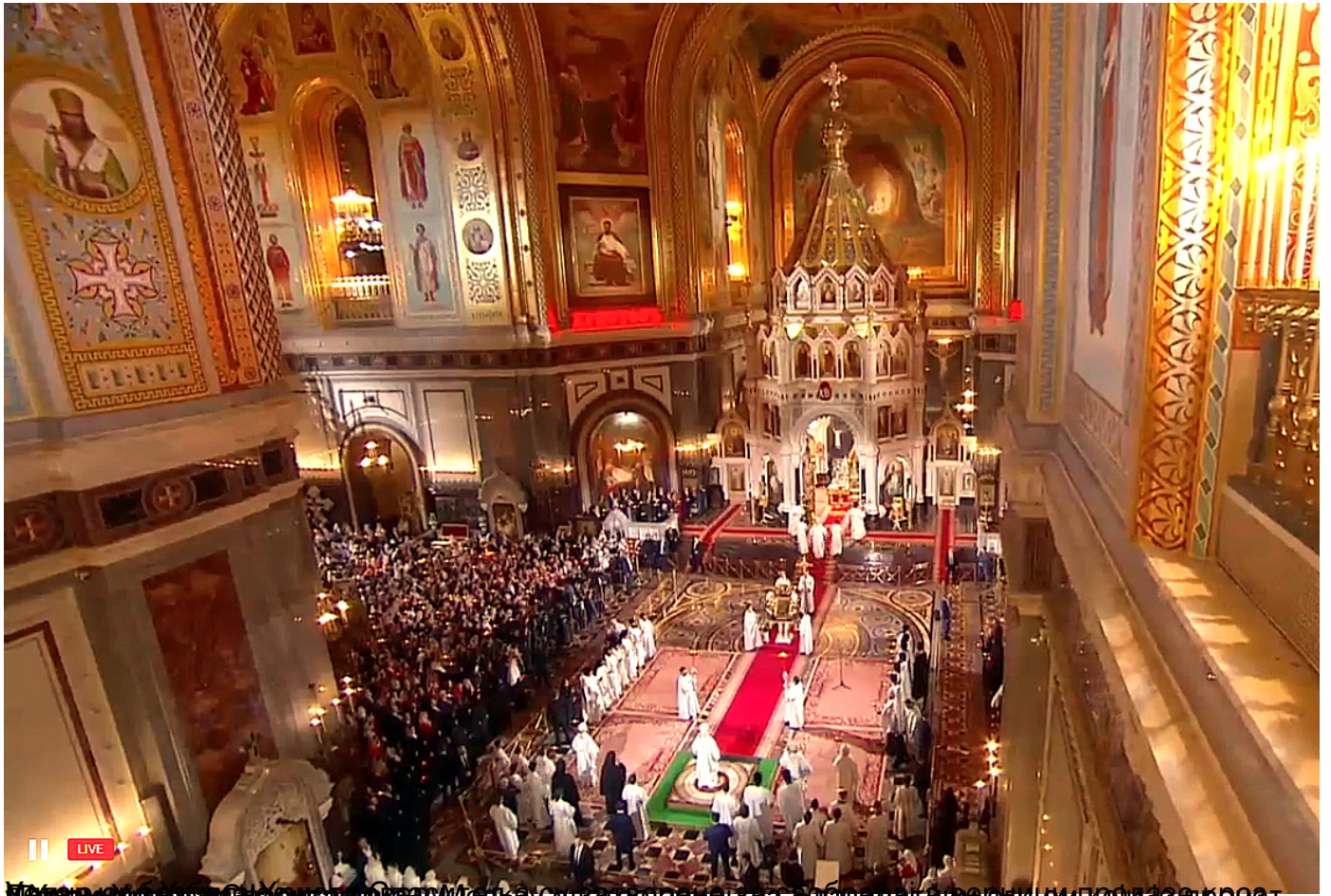
Патријарх Кирил служио Васкршњу литургију у Храму Христа Спаситеља, присуствовао и В