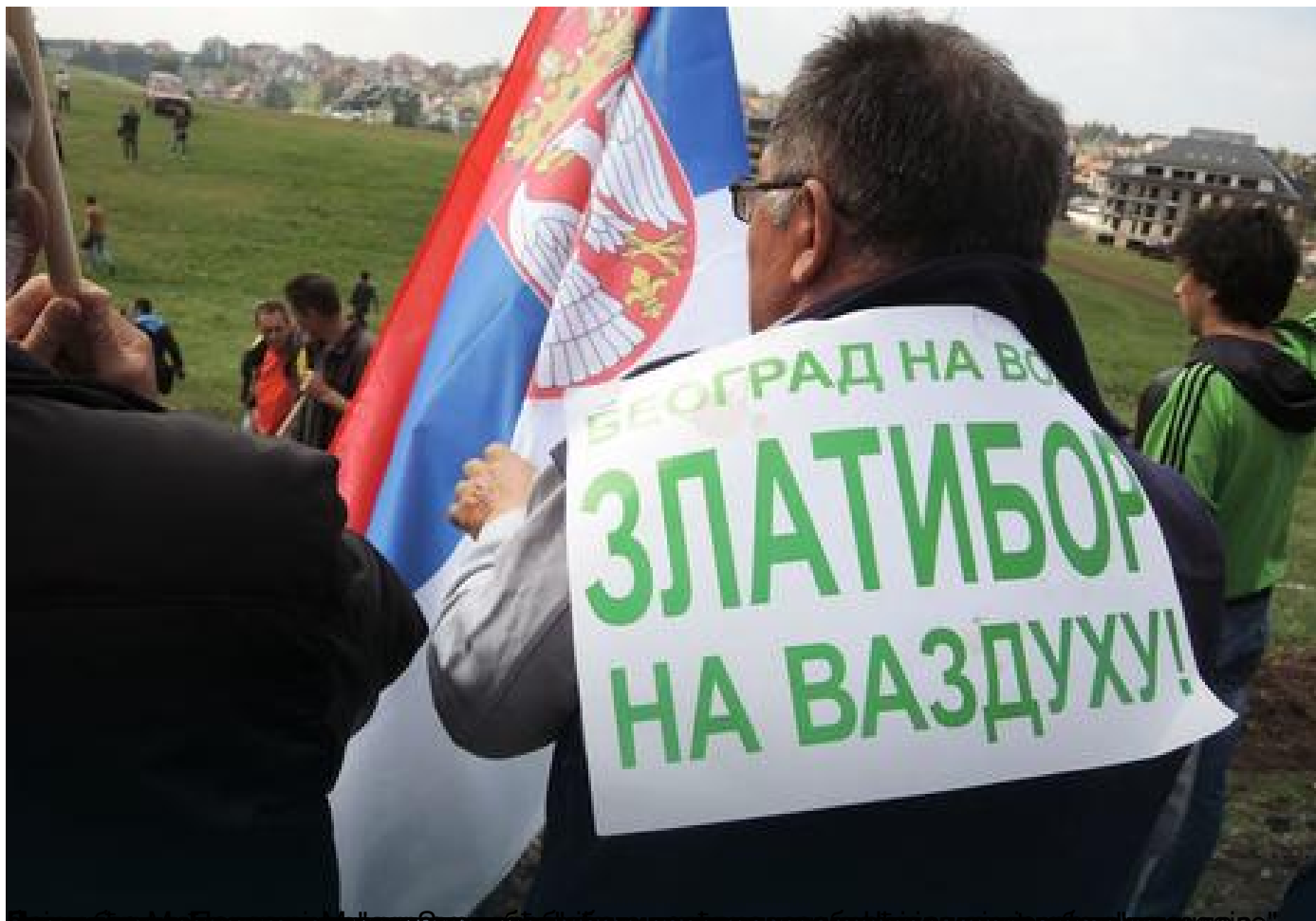
Стаматовић и златиборци протестују испред Владе Србије.