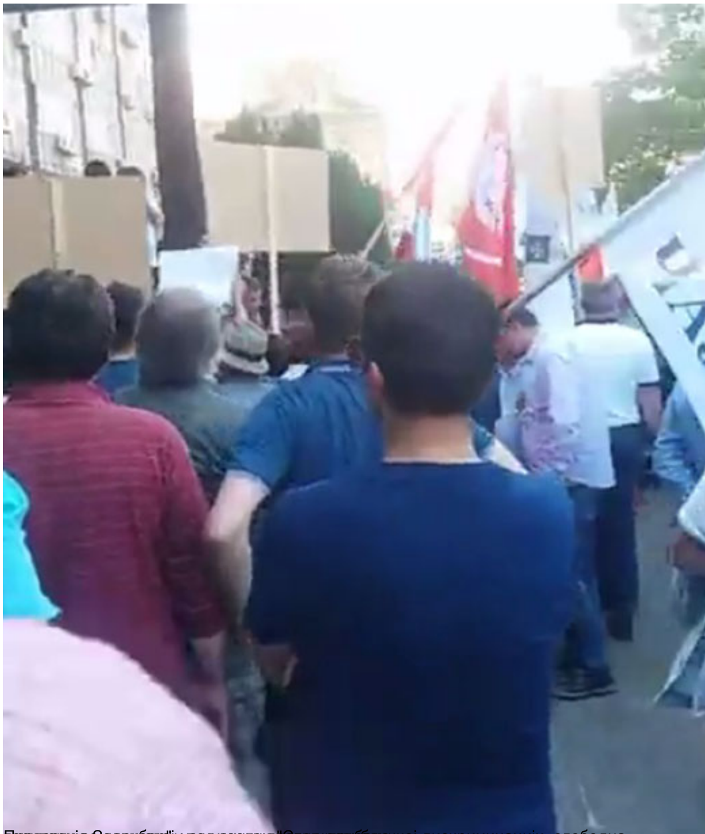
Гротица Зодрица, јуноу зомвек компрателу реубачкој дискриминацији, слободна