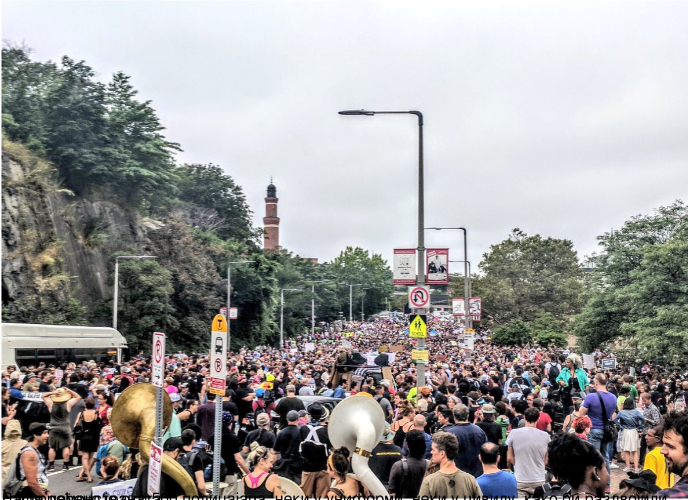
Напољу дејство је ажабо полицајаца, неки у униформи, неки у цивилу, како би раздвојили