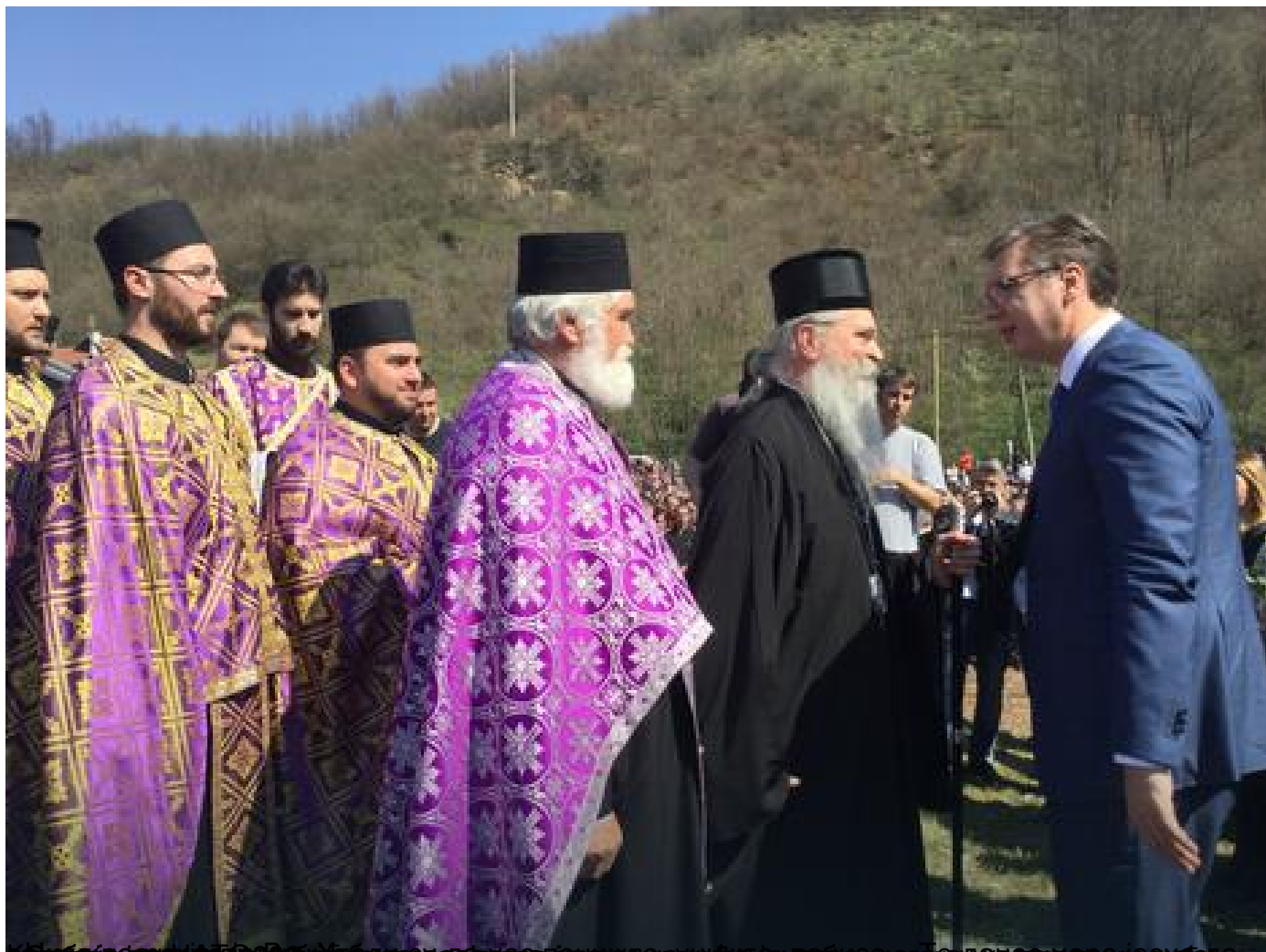
Српски патријарх и епископи на обележавању 18 година од НАТО агресије, у присуству председника Србије Александара Вучића, у околини манастира Дечани, 24. марта 2017. године.